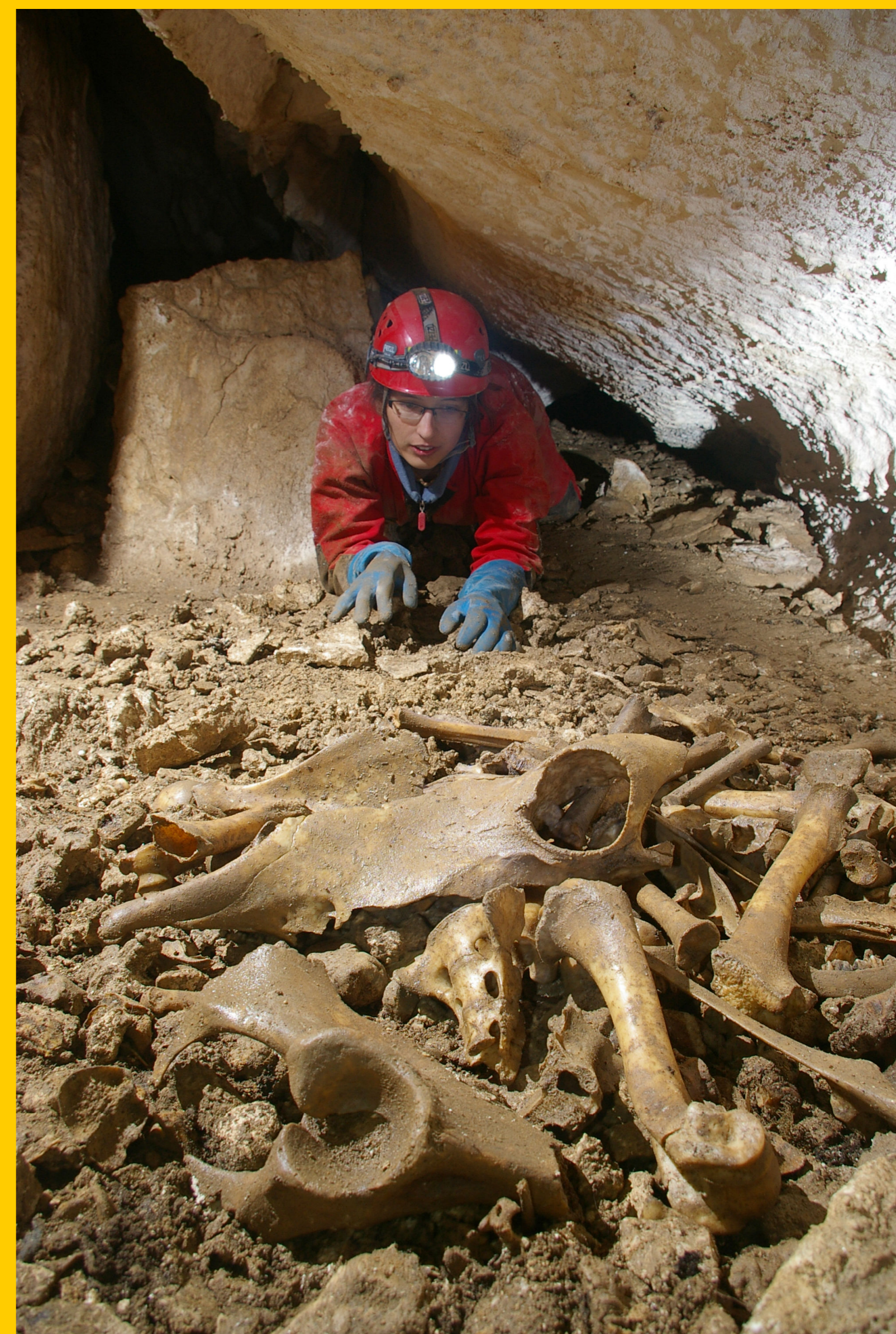
Sala z Klockami, Jaskinia Ziobrowa