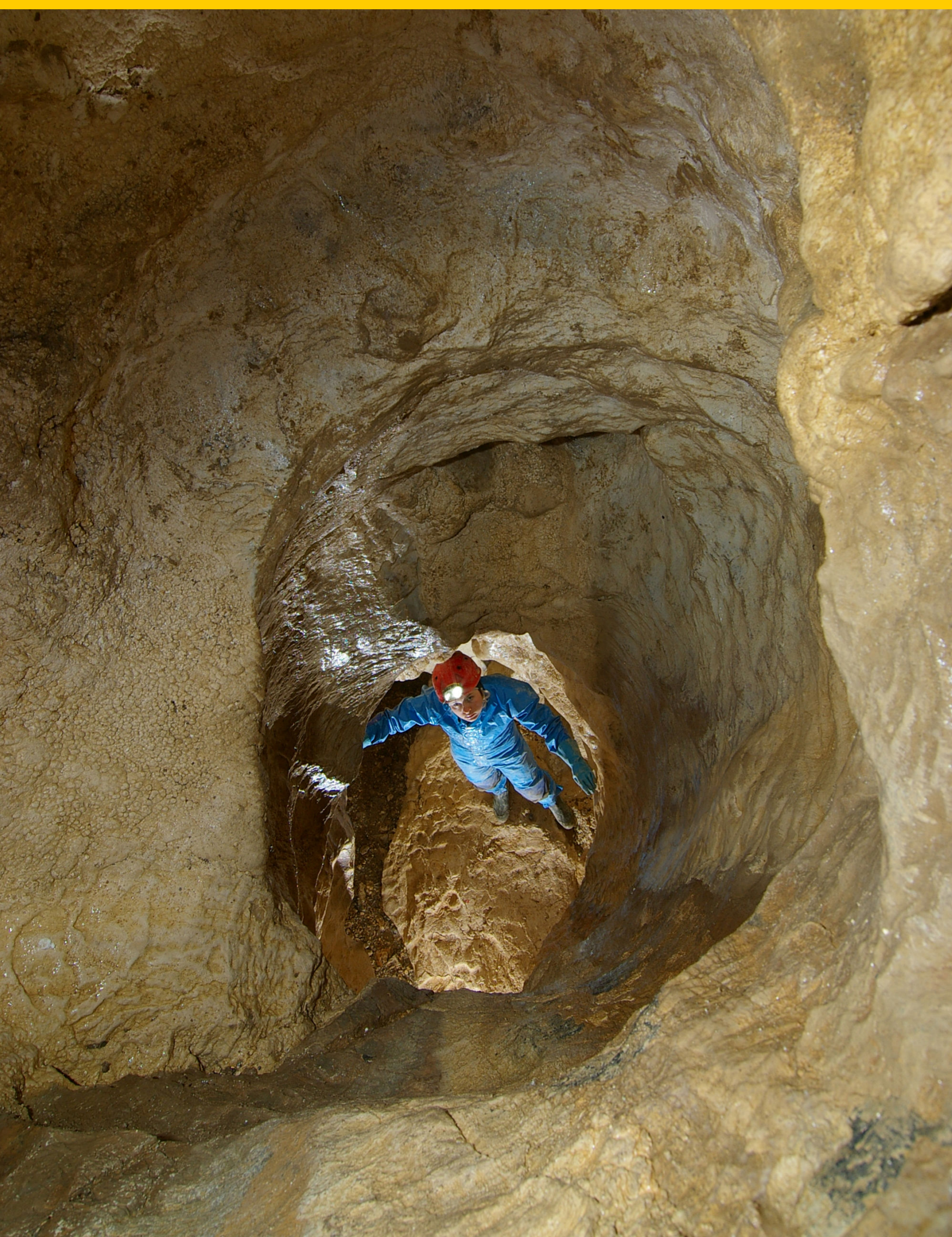
Komin w Kamiennym Mleku

Obszar badań obejmował mniej popularne rejony krasowe polskich Tatr tj. na zachód od masywu Ciemniaka – Dolina Kościeliska, Wąwóz Kraków, Dolina Tomanowa, Dolina Chochołowska, oraz Dolina Jaworzynki i Dolina Miętusia. Działalność terenowa polegała na poszukiwaniu nowych jaskiń, eksploracji w obiektach już znanych i ich dokumentacji. W trudniejszym terenie stosowano odpowiednie techniki taternictwa. Wśród zinwentaryzowanych jaskiń część była już znana, o czym świadczyły ślady poprzedników, którzy bądź zwiedzali je przypadkowo, bądź uznawali je za zbyt małe, aby je dokumentować. Pomiary wykonywano metodą ciągu azymutalnego przy użyciu zestawu suunto i taśmy z włókna szklanego. Opis jaskini zawierał: nazwę, wysokość n.p.m., wysokość nad dnem doliny, długość, głębokość (deniwelację), położenie, morfologiczny opis obiektu, opis klimatu, flory, fauny, historię poznania, plan, przekrój, fotografie. Prace prowadzono w oparciu o środki własne członków klubu.